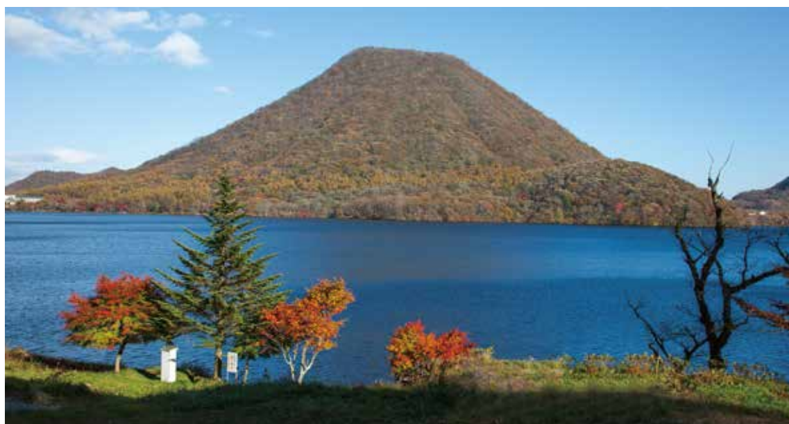
売地から見た正面榛名富士