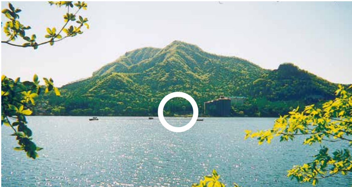
対岸から見た売地